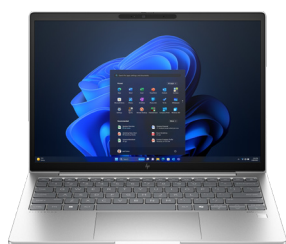
HP EliteBook 630 G11