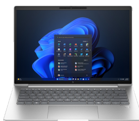
HP EliteBook 640 G11